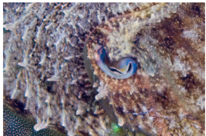
La seiche ( Sepia officinalis ) – Changement stupéfiant de couleur et de motifs ... Homochromie