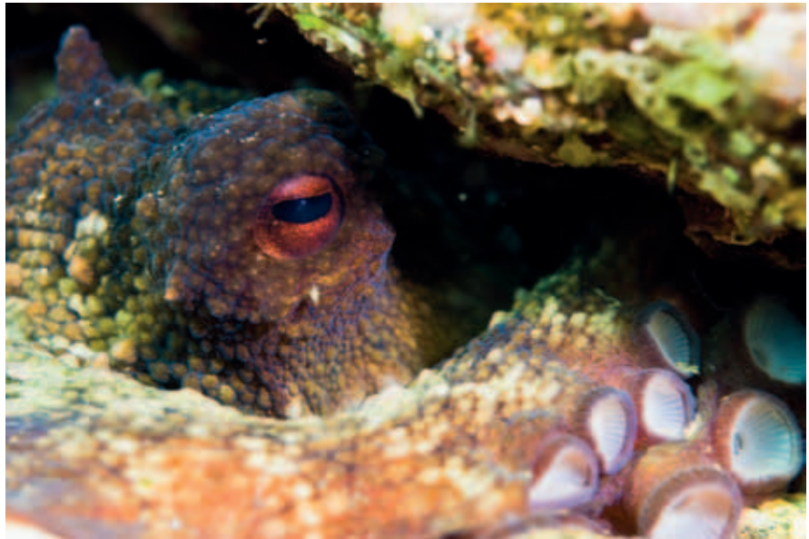
Poulpe ( Octopus vulgaris )

Bien que le terme «mimétisme» évoque généralement tous les phénomènes de camouflage, l'homochromie est un mécanisme particulier et actif de dissimulation extrêmement efficace.