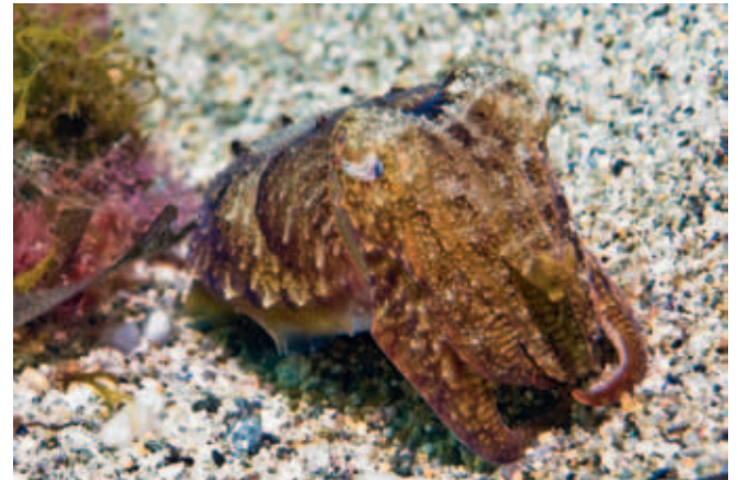
La seiche ( Sepia officinalis ) – Homochromie... Série de photographie prise à la suite montrant parfaitement les variations de couleurs liées à des humeurs ou des comportements (intimidation, reproduction, peur, ...) et qui confèrent à ce mollusque un aspect surréaliste.